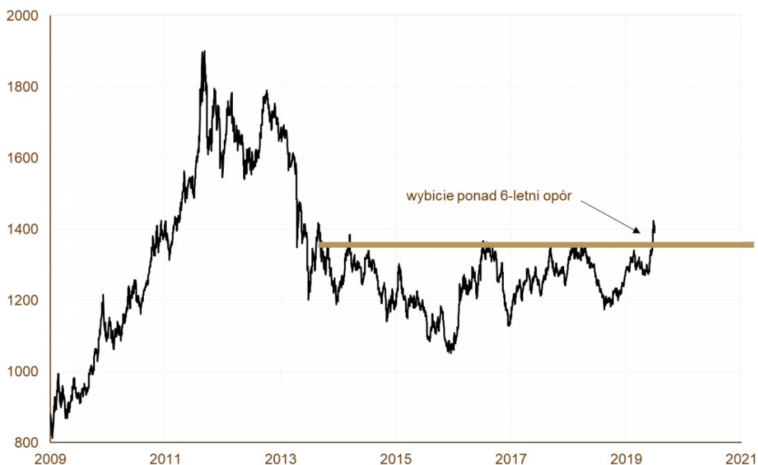
WYKRES 3. Produkcja ropy w krajach podatnych na nieplanowane przestoje w produkcji (tzw. fragile five).