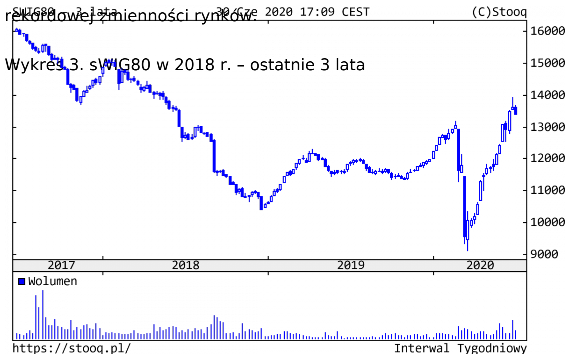
Wykres 3. sWIG80 w 2018 r. - ostatnie 3 lata

Nasz ulubiony indeks sWIG80 wzrósł o 11,4% od początku roku, co należy uznać za wynik bardzo dobry, podobny do Nasdaq. Z pozytywnie zachowujących się walorów, ze stopami zwrotu rzędu +100% (!) i więcej, warto wskazać na producentów gier, sektor medyczny, a także XTB, korzystający na rekordowej zmienności rynków.