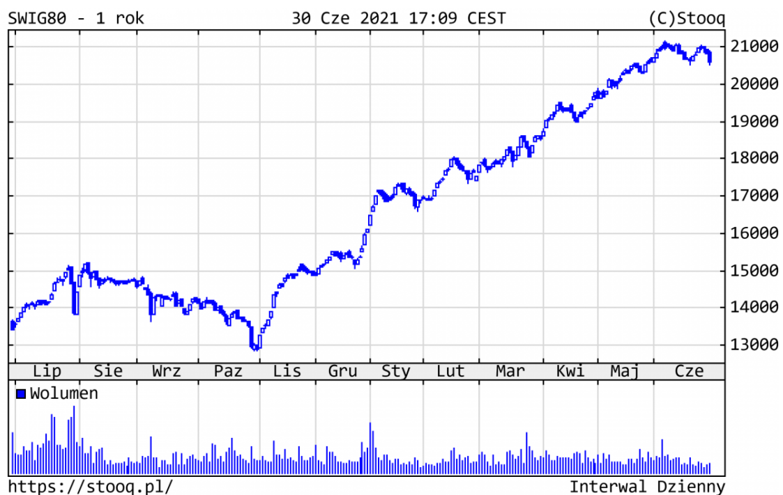
Wykres 3. sWIG80 - ostatni rok

Dobłą passę utrzymywał cały szeroki rynek polskich spółek. Ponad 100 z nich podrożyło w br. już o 53% (!) i więcej. sWIG80 zyskał 27,9%, pozytywnie wyróżniając się na tle indeksów giełdowych na całym świecie. Z najlepiej zachowujących się walorów warto wyróżnić m.in.: Mabion (+236%), Serinus (+214%), Asbis (+173%) czy sektor budowlany, na czele z Erbudem (+221%).