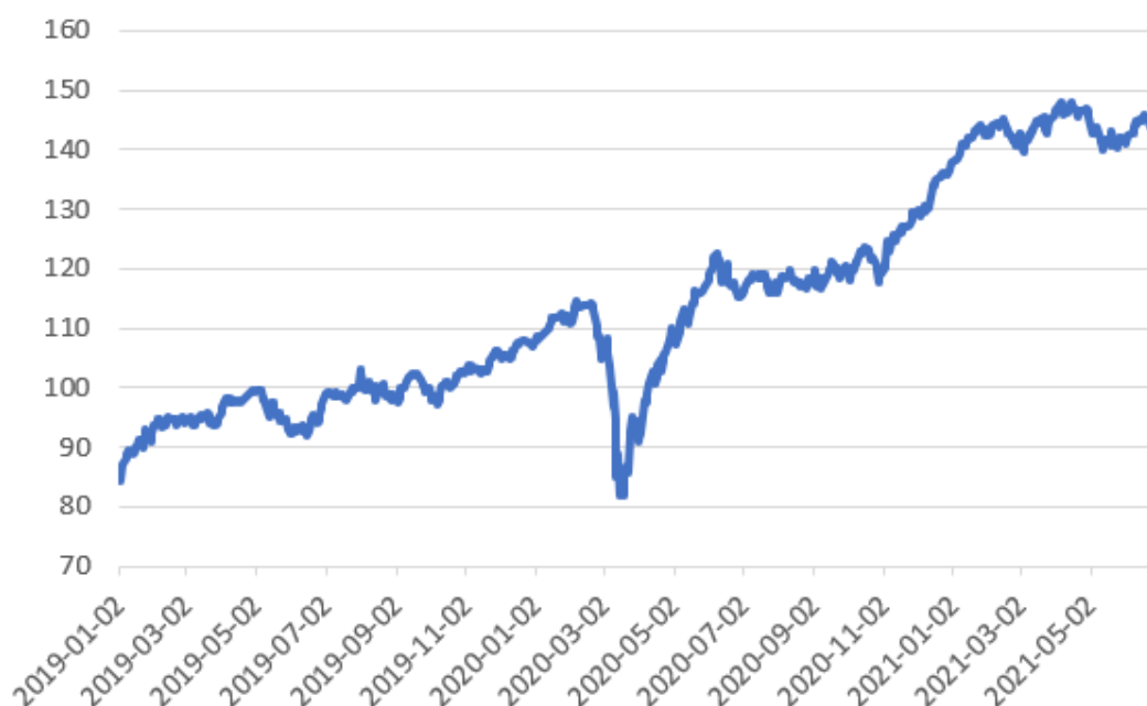
Wykres 1. Wzrost wartości jednostki QUERCUS Global Growth w okresie 2019 - VI 2021

Po bardzo dobrym 2019 r. (wzrost jednostki QUERCUS Global Growth o 28,20%) i 2020 r. (wzrost jednostki QUERCUS Global Growth o 28,75%) również w 2021 r. kontynuowany jest trend wzrostowy. Wycena jednostki w I półroczu 2021 r. wzrosła o 6,73% do 146,98 zł. Warto również dodać, że QUERCUS Global Growth osiągnął dodatnią stopę zwrotu w 9 z ostatnich 10 kwartałów.