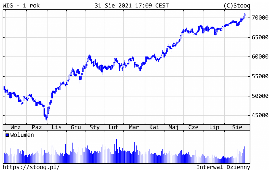
Wykres 2. WIG - ostatni rok

technologiczne (CD Projekt -37% i Allegro -16%).