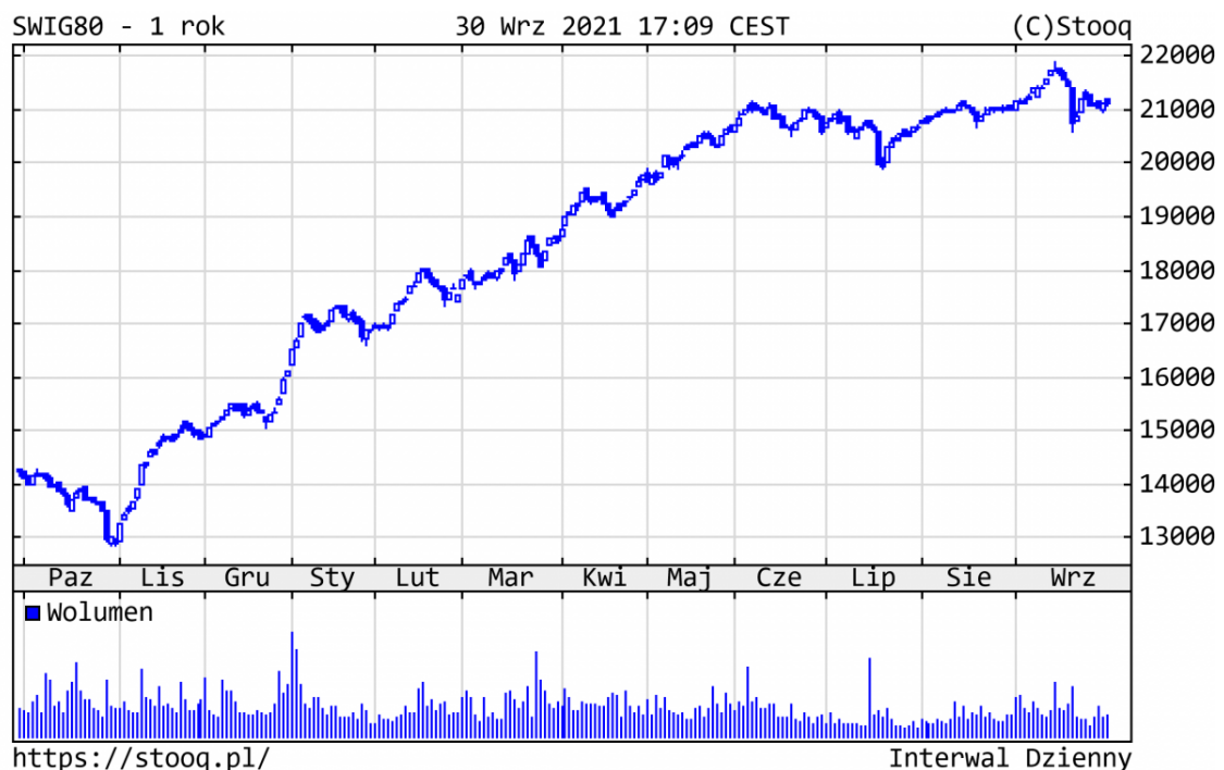
Wykres 3. sWIG80 - ostatni rok

Szeroki rynek polskich spółek pozostawał w trendzie bocznym czwarty miesiąc z rzędu. Od początku br. ponad 100 z nich podrożało o 60% i więcej, a sWIG80 zyskał 31,3%, cały czas pozytywnie wyróżniając się na tle różnych indeksów giełdowych. Z najlepiej zachowujących się walorów warto wyróżnić m.in.: Serinus (+253%), Mabion (+247%), Asbis (+211%), czy sektor budowlany, na czele z Erbudem (+182%).