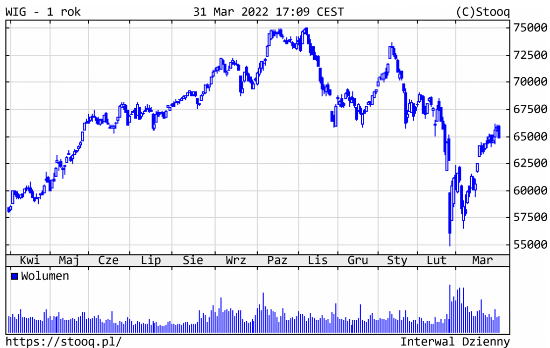
Wykres 2. WIG - ostatni rok