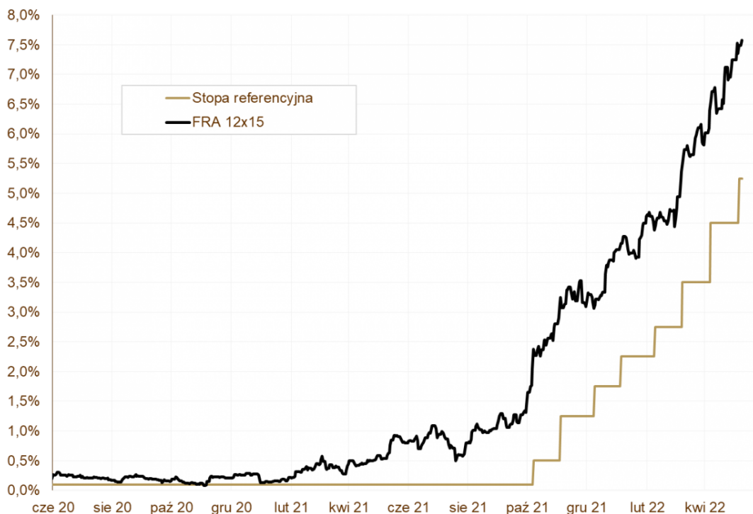
WYKRES 3. Stopa NBP i oczekiwany WIBOR3M za rok.

zdecydował się na mocniejszą skalę podwyżek stóp procentowych, większą wagę przykładając do bieżących odczytów inflacyjnych niż do perspektyw PKB. Prawdopodobnie podwyżki będą kontynuowane, aż inflacja zacznie stopniowo opadać. Zdaniem prezesa A. Glapińskiego szczyt inflacji może wystąpić w czerwcu. Obecnie instrumenty finansowe wyceniają stopę docelową w okolicach 7,0-7,5%. Najbliższy kwartał pozostanie pod wpływem podwyższonej zmienności , którą potęgować będą informacje napływające z Ukrainy.