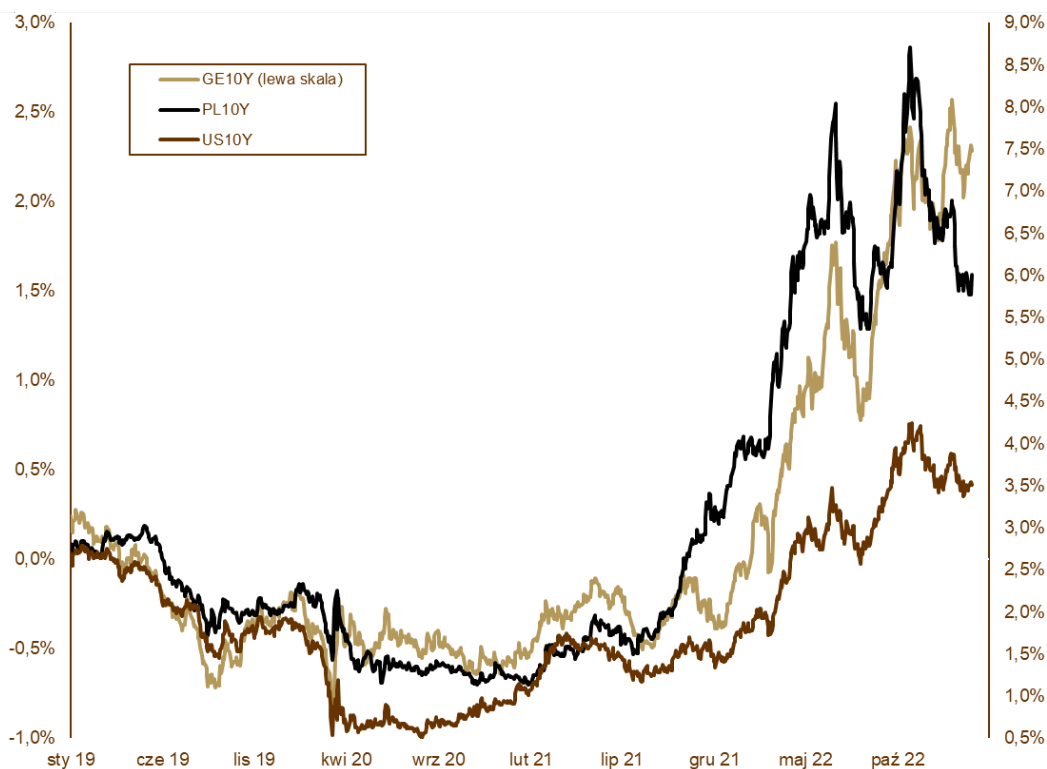
WYKRES 2. Zmiany rentowności 10-letnich obligacji skarbowych.

prognozujemy inflację jednocyfrową. Obligacje skarbowe w styczniu naśladowały rynki bazowe. Kierunek był ten sam, ale siła znacznie wyższa, co pozwoliło na ponadprzeciętne zyski. Rentowność polskich, 10-letnich obligacji skarbowych spadła z 6,85% do 6,01%, 5-letnich z 6,84% do 5,96%, a dwulatek z 6,68% do 6,03%. Początek lutego przynosi kontynuację pozytywnych tendencji.