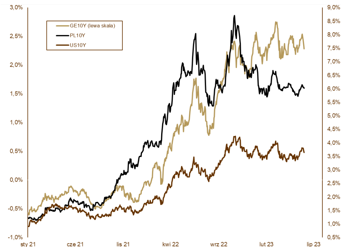
WYKRES 2. Zmiany rentowności 10-letnich obligacji skarbowych.

Rentowność niemieckiego Bunda pozostała w okolicach 2,30%, a to tylko dlatego, że w ostatnich dniach maja nadeszły dane sugerujące, że presja inflacyjna w strefie euro stopniowo ustaje. Gdyby nie to, skala ruchu byłaby podobna do tej po drugiej stronie oceanu. Wraz z rentownościami odwróciły się tendencje na EURUSD. Dolar zyskał do euro 3,5%. Obligacje skarbowe w Polsce zachowywały się analogicznie do niemieckich. Spektakularne było zwłaszcza umocnienie w ostatnich 3 dniach maja. Rentowność polskich 10-letnich obligacji skarbowych wzrosła z 5,89% do 6,02%, 5-letnich z 5,87% do 5,94%, a dwulatek z 5,84% do 5,91%.