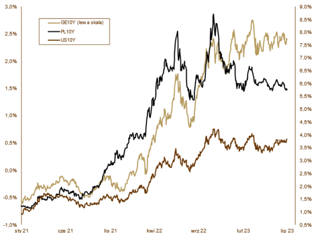
WYKRES 2. Zmiany rentowności 10-letnich obligacji skarbowych.

Rynek wycenia bowiem sześć obniżek stóp w horyzoncie roku, z czego cztery miałyby nastąpić już w przeciągu najbliższego półrocza. Podczas lipcowego posiedzenia RPP nie zmieniła stóp procentowych, ale poznaliśmy kilka ciekawych informacji. Po pierwsze, cykl podwyżek stóp procentowych został oficjalnie zakończony (choć i tak nikt nie wierzył w jego kontynuację). Po drugie, prezes Adam Glapiński zapowiedział rozpoczęcie cyklu luzowania już po wakacjach . Aby tak się stało muszą zostać spełnione dwa warunki. Inflacja konsumencka musi spaść poniżej 10% oraz projekcje inflacyjne muszą wskazywać na silny trend dezinflacyjny w kolejnych miesiącach. Szanse na pierwsze obniżki widzimy już we wrześniu . Polskie skarbówki kontynuowały pozytywny trend z poprzednich miesięcy. Rentowność 10-letnich obligacji spadła z 6,02% do 5,76%, 5-letnich z 5,94% do 5,63%, a dwulatek z 5,91% do 5,77%. Złotówka nadal umacniała się. Kurs euro spadł z 4,53 do 4,43, a dolara z 4,26 do 4,06.