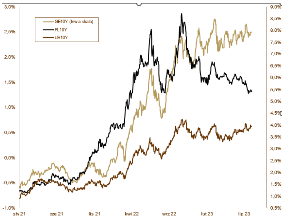
WYKRES 2. Zmiany rentowności 10-letnich obligacji skarbowych.

konferencji prezes EBC Ch. Lagarde - wszystko zależy od napływających danych. Rentowność amerykańskiej 10-letniej obligacji wzrosła z 3,84% do 3,96%, a niemieckiej z 2,39% do 2,49%. Polska inflacja konsumencka również zawróciła kilka miesięcy temu. Najbliższe miesiące przyniosą dalsze spadki, ale tempo nie będzie już tak spektakularne. Podczas lipcowego posiedzenia RPP nie zmieniła stóp procentowych, ale poznaliśmy kilka ciekawych informacji. Po pierwsze, cykl podwyżek stóp procentowych został oficjalnie zakończony. Po drugie, prezes Adam Glapiński zapowiedział rozpoczęcie cyklu luzowania już po wakacjach. Aby tak się stało muszą zostać spełnione dwa warunki. Inflacja konsumencka musi spaść poniżej 10% oraz projekcje inflacyjne muszą wskazywać na silny trend dezinflacyjny w kolejnych miesiącach. Polskie skarbówki kontynuowały pozytywny trend z poprzednich miesięcy. Jest to o tyle zaskakujące, że mocno kontrastuje z zachowaniem zagranicznych benchmarków. Rentowność 10-letnich obligacji spadła z 5,76% do 5,42%, 5-letnich z 5,63% do 5,28%, a dwulatek z 5,77% do 5,34%.