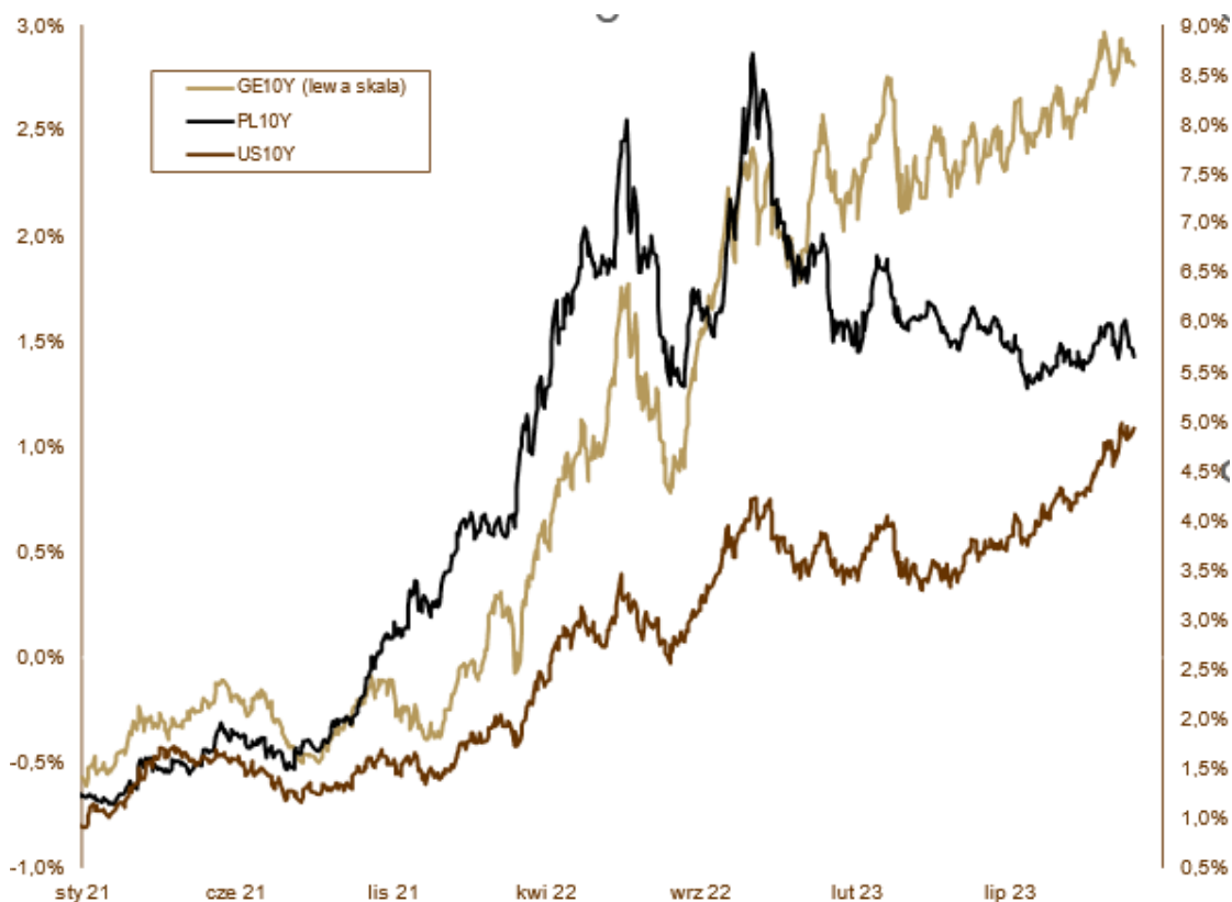
WYKRES 2. Zmiany rentowności 10-letnich obligacji skarbowych.

a z konferencji prezesa A. Glapińskiego wynika, że kolejne obniżki mogą nastąpić najwcześniej w marcu. To z kolei nie spodobało się rynkowi dłużnemu i początek listopada przyniósł korektę. Rentowność 10-letnich obligacji spadła w październiku z 5,90% do 5,65%, 5-letnich wzrosła z 5,24% do 5,30%, a dwulatek wzrosła z 4,97% do 5,15%. Kurs euro spadł w październiku o 17 groszy, co oznacza umocnienie złotówki o ok 3,7%. Zagraniczne wydarzenia zdominowane zostały przez posiedzenia banków centralnych. Tym razem ani amerykański FED, ani Europejski Bank Centralny nie zmieniły parametrów swojej polityki. Można śmiało założyć, że do dalszego zacieśnienia w tym cyklu już nie dojdzie. Brak podwyżek nie oznacza jednak wcale, że szybko ujrzymy obniżki stóp procentowych. Polityka zapowiedziana zarówno przez prezesa J. Powella, jak i panią prezes Ch. Lagarde, zakłada utrzymywanie stosunkowo drogiego pieniądza przez przedłużony okres czasu. Obecna wycena rynkowych stóp procentowych wskazuje, że pierwsze półrocze nie przyniesie zaskakujących decyzji, a początku luzowania należy spodziewać się najszybciej w lipcu przyszłego roku. Rentowność amerykańskiej 10-letniej obligacji wzrosła z 4,57% do 4,93%, podczas gdy rentowność niemieckiego Bunda pozostała w okolicach 2,80%. Słabsze zachowanie amerykańskiego długu wynika z dobrych danych. PKB w trzecim kwartale wzrósł aż o 4,9% w ujęciu zannualizowanym, podczas gdy niemiecka gospodarka boryka się z recesją.