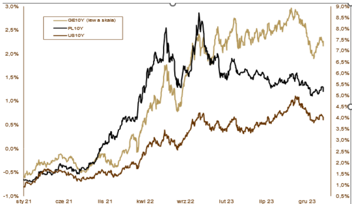
WYKRES 2. Zmiany rentowności 10-letnich obligacji skarbowych.

luzowanie polityki monetarnej jest mało prawdopodobne. W styczniu rentowność 10-letnich niemieckich Bundów wzrosła z 2,02% do 2,17%, a amerykańskich Treasuries z 3,88% do 3,91%. Rentowność polskich, 10-letnich obligacji skarbowych pozostała w okolicach 5,20%, a 5-letnich w okolicach 5,00%. Jedyne rentowność dwulatek spadła znacząco z 4,98% do 4,83%. Złoty kontynuował swoją passę rozpoczętą po wyborach parlamentarnych. Tym razem umocnił się do euro o 0,3%. Tendencje światowe, m.in. lepsze dane z amerykańskiej gospodarki niż z Europy, wpłynęły na spadek kursu EUR/USD. Dolar zyskał niecałe 2%.