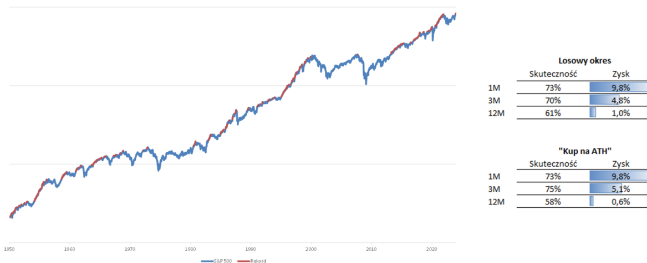
Wykres. 2. Szczyt na S&P 500 nie jest niczym nadzwyczajnym

Trwający obecnie w USA sezon wyników za 4Q23, po raz kolejny zaskakuje inwestorów pozytywnie. Na ten moment w ramach indeksu S&P500 zaraportowało 320 spółek (dane na 08.02.2024 r.), z czego w ok. 77% przypadkach spółki zaraportowały lepsze wyniki na poziomie zysku netto od konsensusów rynkowych. Wśród największych amerykańskich spółek, niekwestionowanymi zwycięzcami byli: Meta, Amazon i Microsoft. Meta po publikacji wyników za 4Q23 rosła nawet